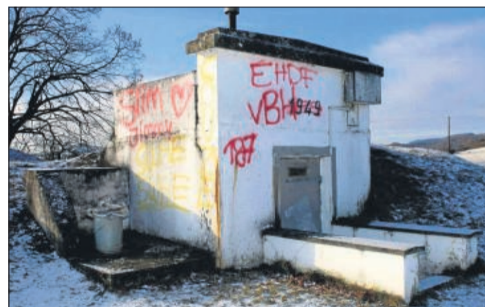
Mit Graffiti beschmiert: Der alte Hochbehälter „Überm Zollstock“ in Dodenau.

Feststellung des oder der Täter führen, zahlt die Stadt eine Belohnung von 300 Euro. (nh/off)