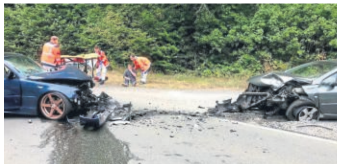
Zweimal Totalschaden und drei Verletzte: Das ist die Bilanz eines Verkehrsunfalls, der sich am Dienstag zwischen Friedrichshausen und Römershausen ereignete.